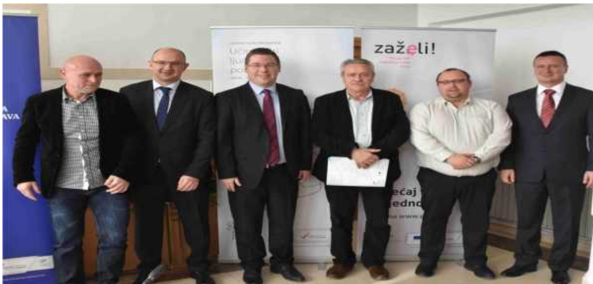
Slika 1. S potpisivanja Ugovora o dodjeli bespovratnih sredstava za projekt „Pomo sebi i drugima“

Ministarstva rada mirovinskog sustava, obitelji i socijalne politike (UT) je izvršilo uplatu sredstava u ugovorenim okvirima. Iskorištenost ugovorenih ukupnih sredstava projekta je primjer dobre prakse. Na konkretnom projektu od ukupno ugovorenog iznosa, 0,42% su neiskorištena sredstava.