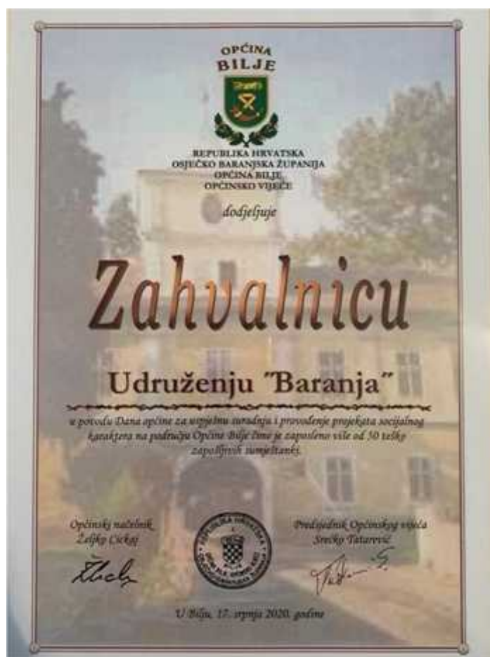
Slika 18. Zahvalnica Općine Bilje

U povodu Dana Općine Bilje – Dana povratka dodijeljena su Javna Priznanja Općine Bilje. Među dobitnicima je i Udruženju Baranja, Ul. Šandora Petefija 92, 31328, Lug, za uspješnu suradnju i provođenje projekata socijalnog karaktera na području Općine Bilje čime je zaposleno više od 50 teško zapošljivih sumještanki.