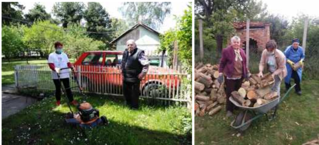
Slika 5. Sa aktivnosti na terenu