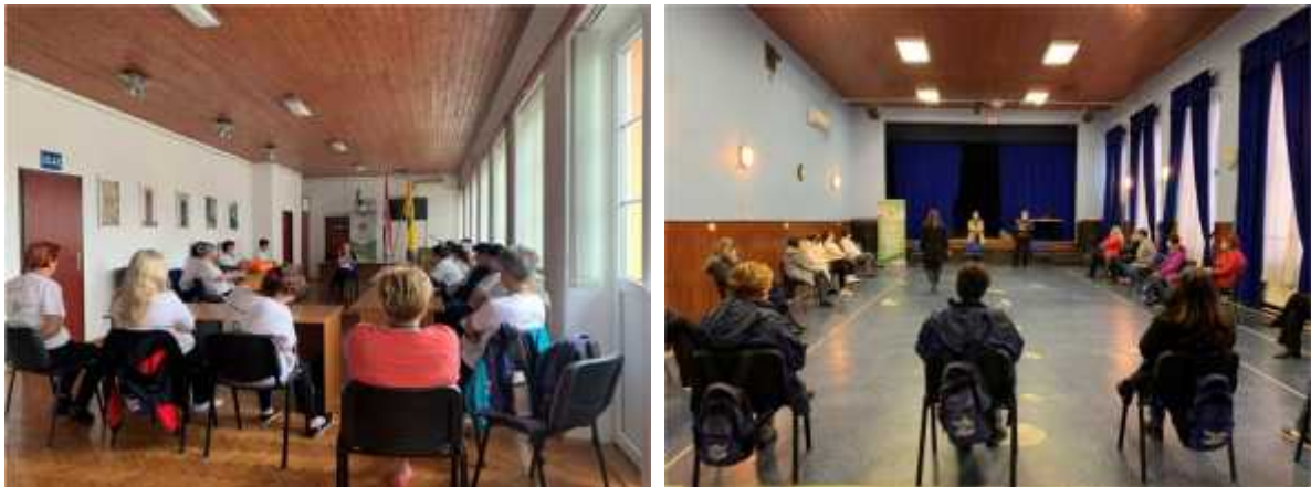
Slika 09. Važno je osnaživanje zaposlenih žena

Tijekom provedbe projekta u 2020. godini zaposlene žene pružile su uslugu pomoći u kući u ukupnom broju od 240 krajnjih korisnika, od kojih je 149 korisnica i 91 korisnik. U Općini Bilje u prosjeku po zaposlenici dodijeljeno je 12 korisnika.