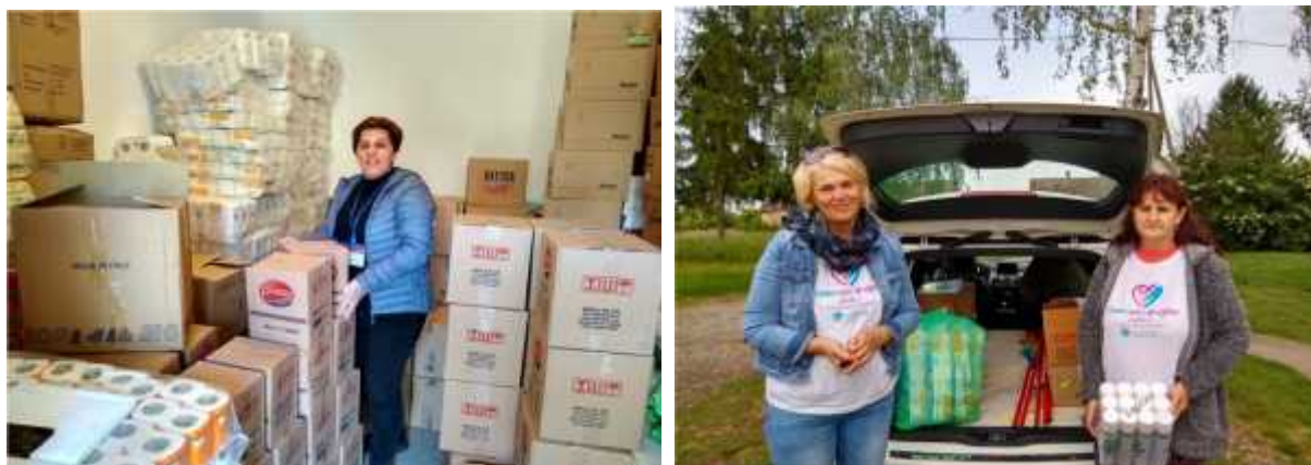
Slika 2. Završne pripreme za isporuku ku njih potrepština za krajnje korisnike