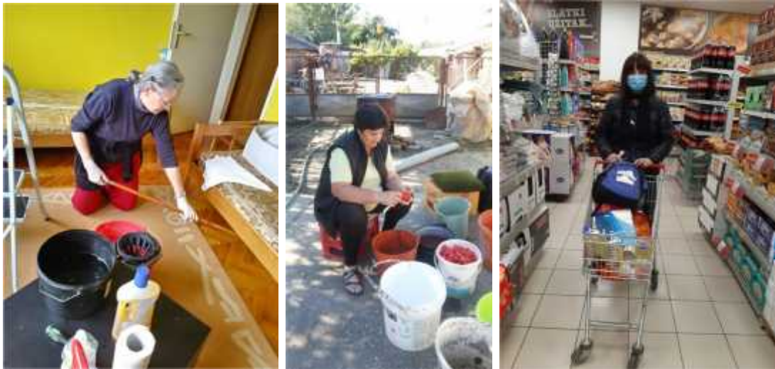
Slika 08. Neke od aktivnosti zaposlenih žena na terenu