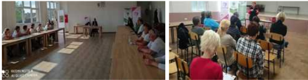
Slika 4. Psihološke radionice osnaživanja zaposlenih žena i edukacija udruge JAKA